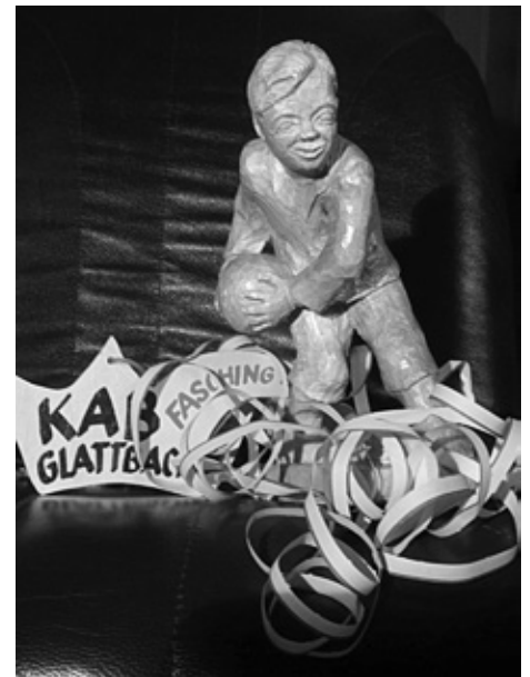
Maskottchen der KAB Kegler

wer hätte das von einem katholischen Verein gedacht?