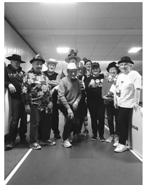
Die Kegler vom Fasnachtfreitag