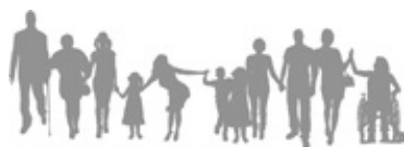
HOSPIZGRUPPE Aschaffenburg e.V.