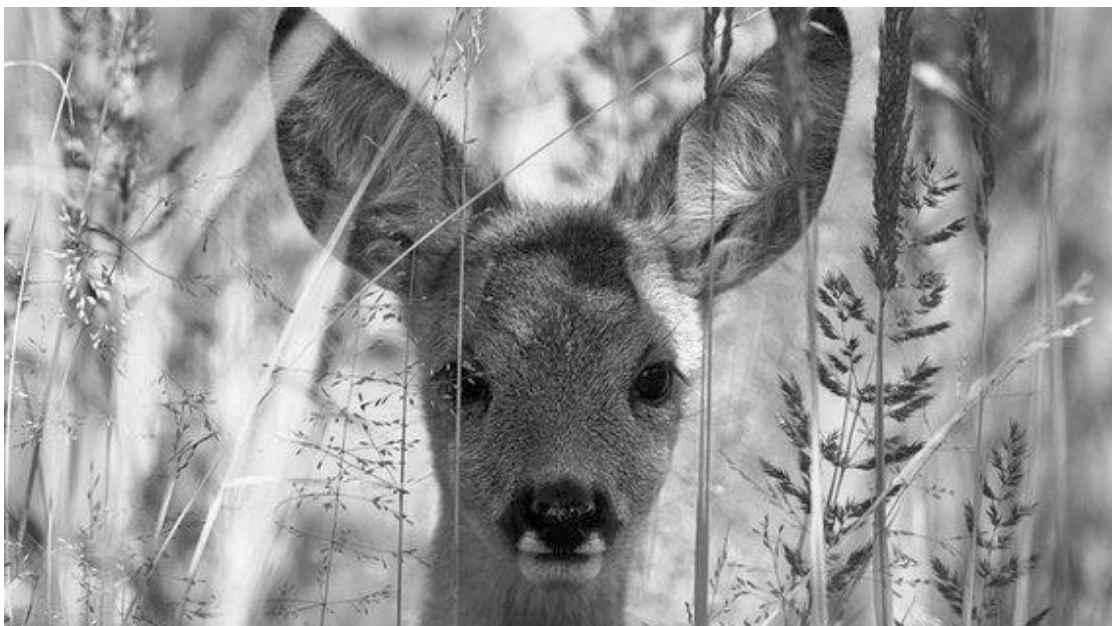
Tier-Nachwuchs wie das Rehkitz braucht Schutz vor freilaufenden Hunden.