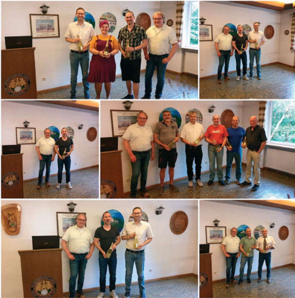
1. Reihe v.l. 1. Luftgewehr, 1. Luftpistole, 2. Reihe v.l. FreiePistole, 3. Sportpistole 3. Reihe v.l. 1. Sportpistole, 2. Luftpistole