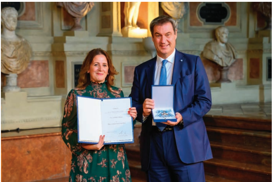
Bayerische Staatskanzlei - Nilüfer Ulusoy, Ministerpräsident Markus Söder

Der Verdienstorden wird verliehen als Zeichen ehrender und dankbarer Anerkennung für hervorragende Verdienste um den Freistaat Bayern und das bayerische Volk. Eine Besonderheit ist die Begrenzung der Zahl der lebenden Ordensträger auf 2000 Personen.