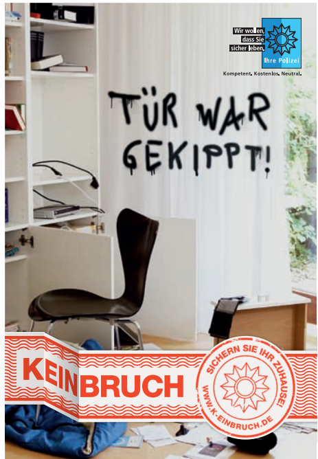
Quelle: Polizeiliche Kriminalprävention der Länder und des Bundes Umfangreiches Informationsangebot unter http://www.k-einbruch.de