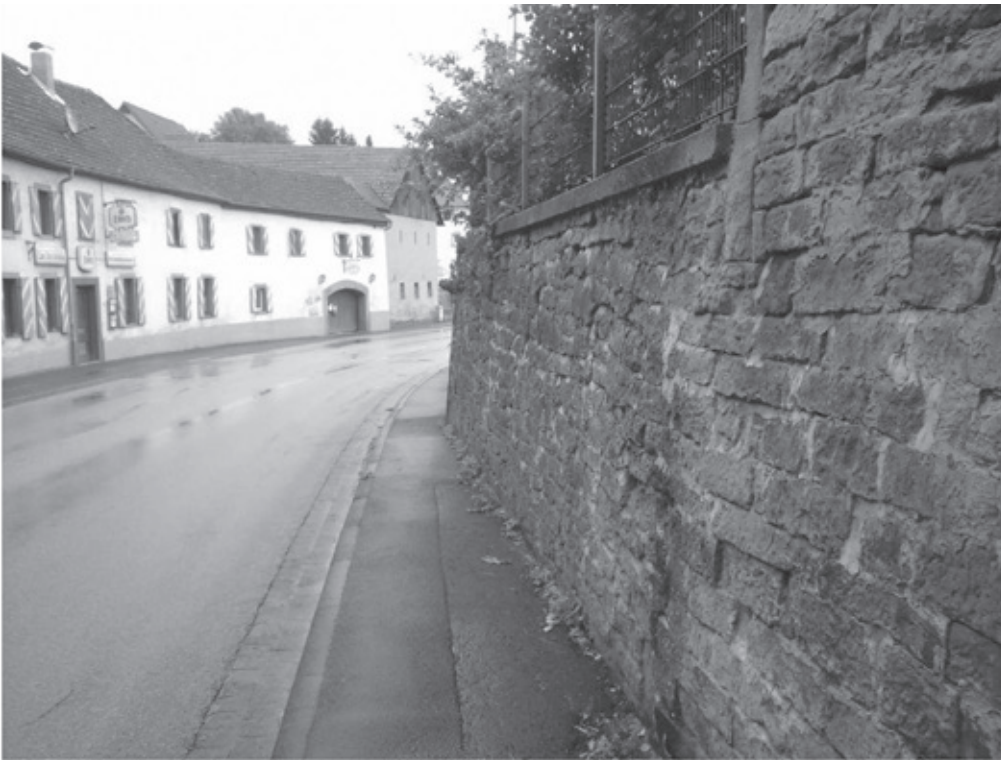
Die ursprüngliche Eingangssituation, rechts die nicht mehr vorhandene Rotsandsteinwand