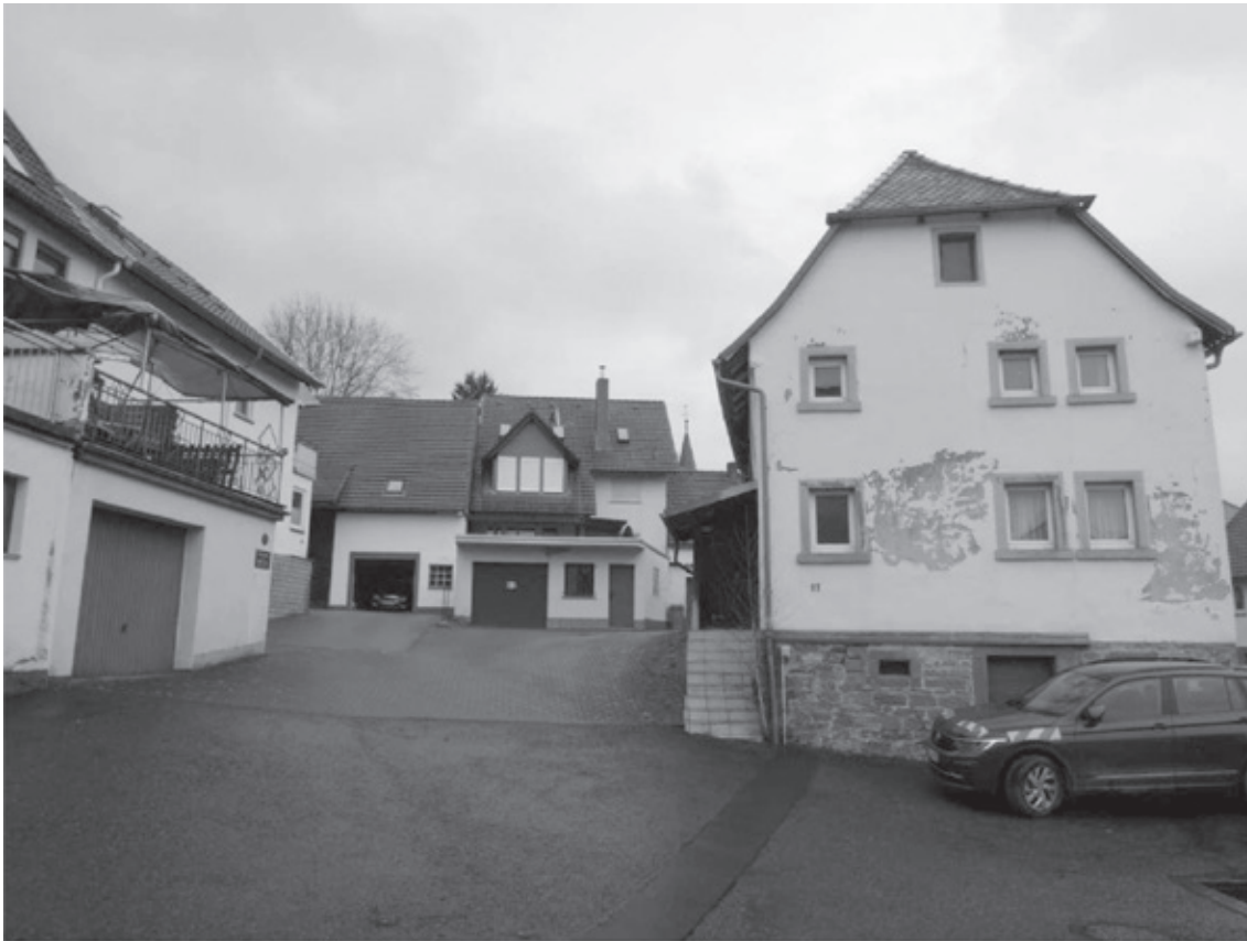
Die Giebelwand des Kopfbaus der drei Gebäude in der Aschaffenburgerstraße mit Sandsteinsockel und Gewänden und Krüppelwalm