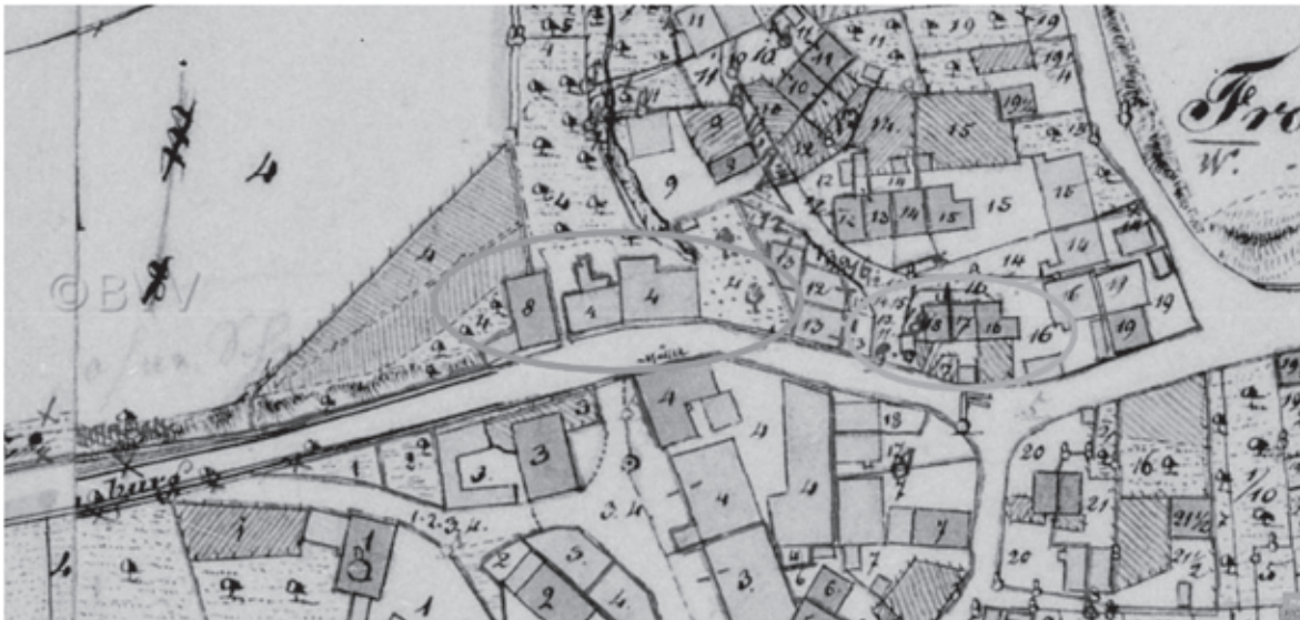
Auszug Uraufnahme

Das sogenannte Brauhaus im Ortsteil Frohnhofen der Gemeinde Laufach stellt einen wichtigen, historisch tradierten Baustein im städtebaulichen Gefüge des Ortsteils dar. Frohnhofen hat sich fast ausschließlich nach Norden und Osten entwickelt. Der westliche Ortseingang war bis vor wenigen Jahren noch annähernd so wie zur Zeit der Uraufnahme.