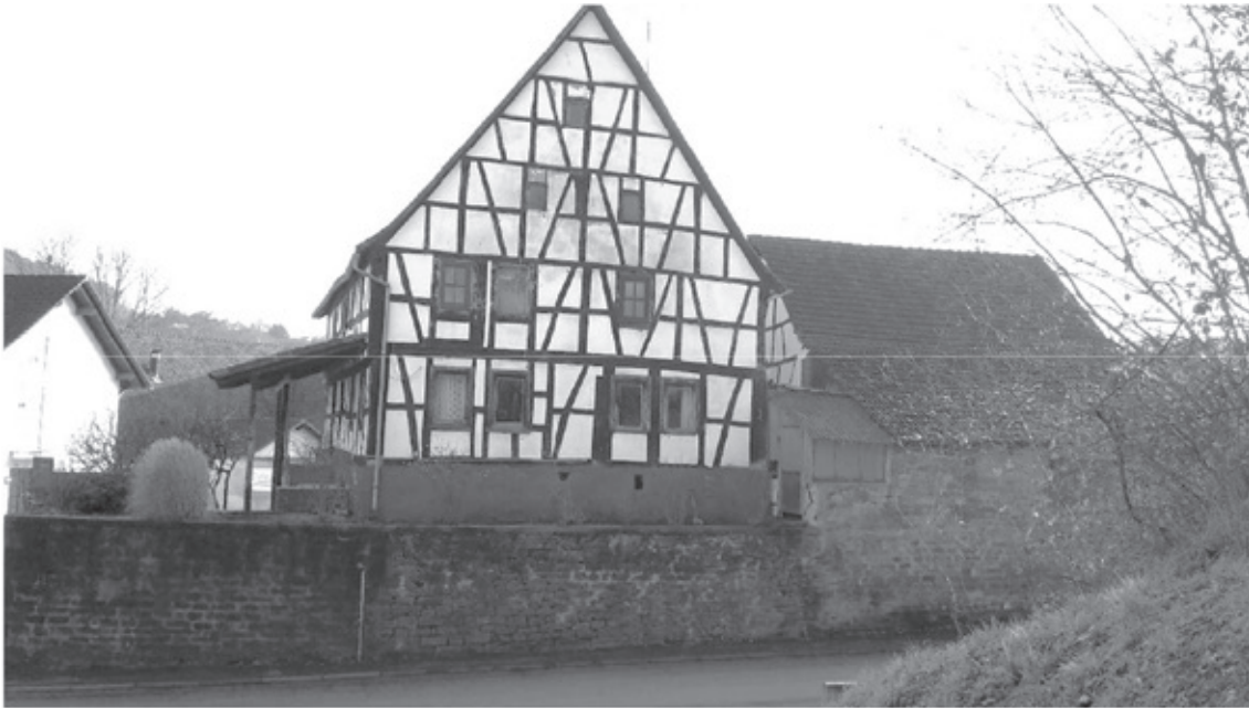
Das abgebrochene Fachwerkhaus in der Aschaffenburg Straße von Norden