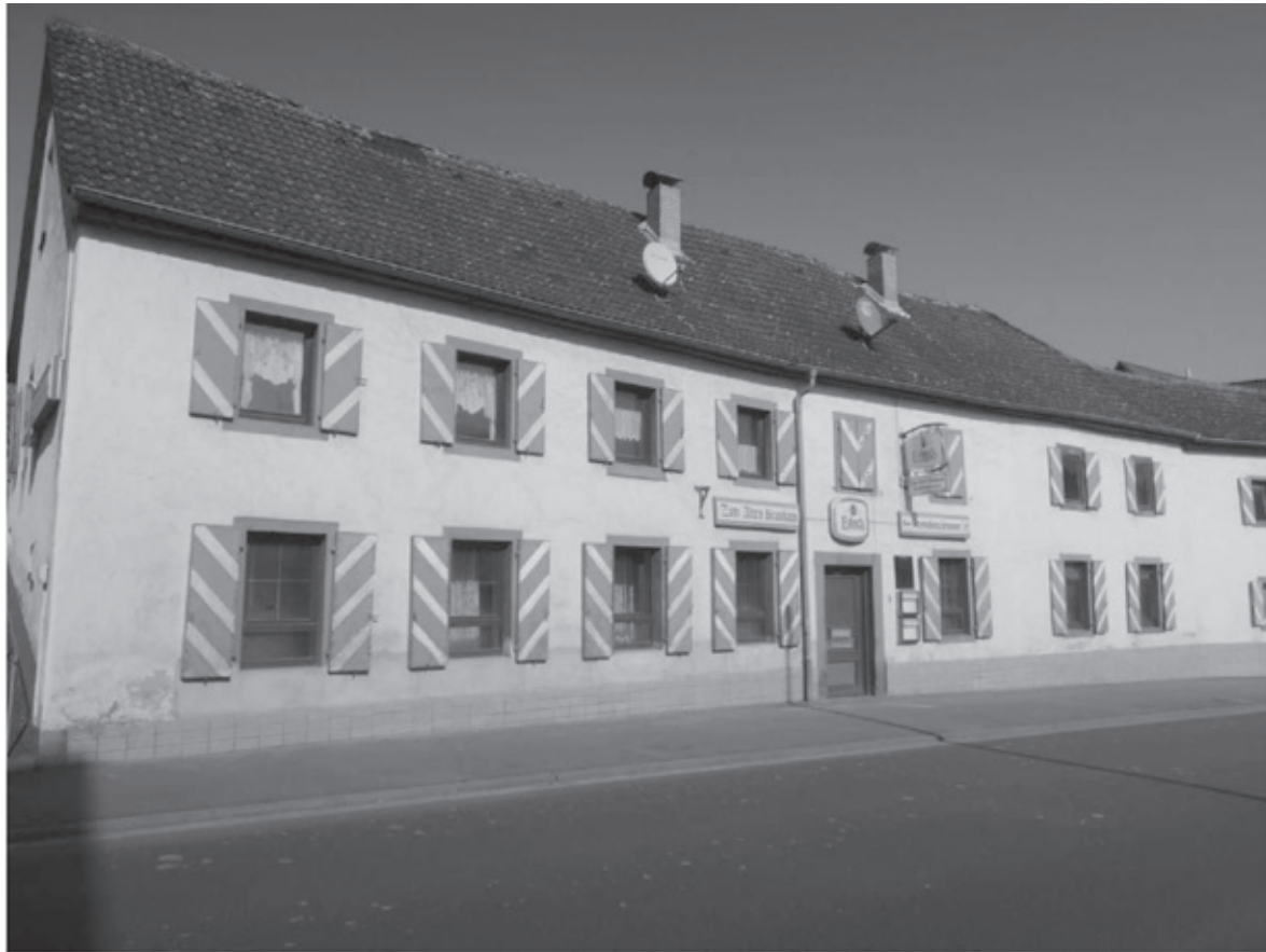
Der Detailreichtum und die handwerkliche Qualität des Brauhauses