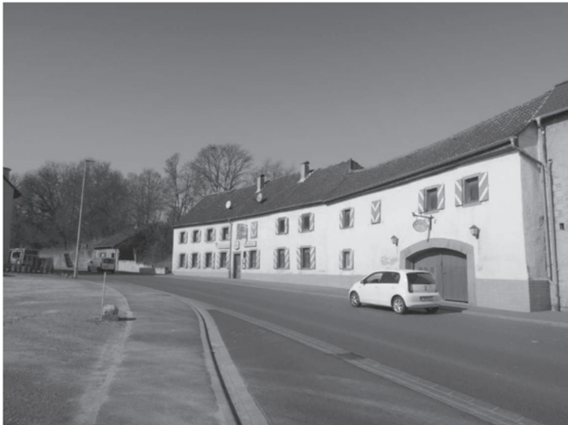
Auch aus Laufach kommend stellt das Gebäude eine bedeutende städtebauliche Anlage dar.