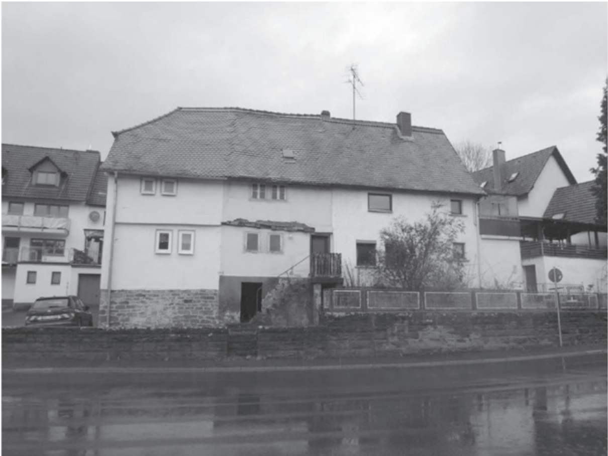
Das Gebäude mit Krüppelwalm und Natursteinsockel (Traufseite)