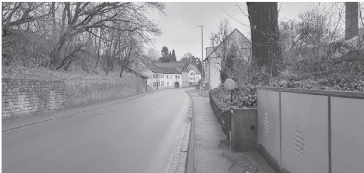
Der Ortseingang von Aschaffenburg kommend. Links im Bild die Sandsteinwand mit Böschung, das „abknickende“ Brauhaus und die Wohnhäuser in der Ortsmitte mit dem Krüppelwalm.

Durch die Erhaltungssatzung werden so die städtebaulichen Ziele der Erhaltung und Fortentwicklung des Ortsbildes erreicht.