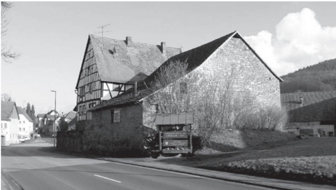
Das abgebrochene Fachwerkhaus in der Aschaffenburger Straße von Westen