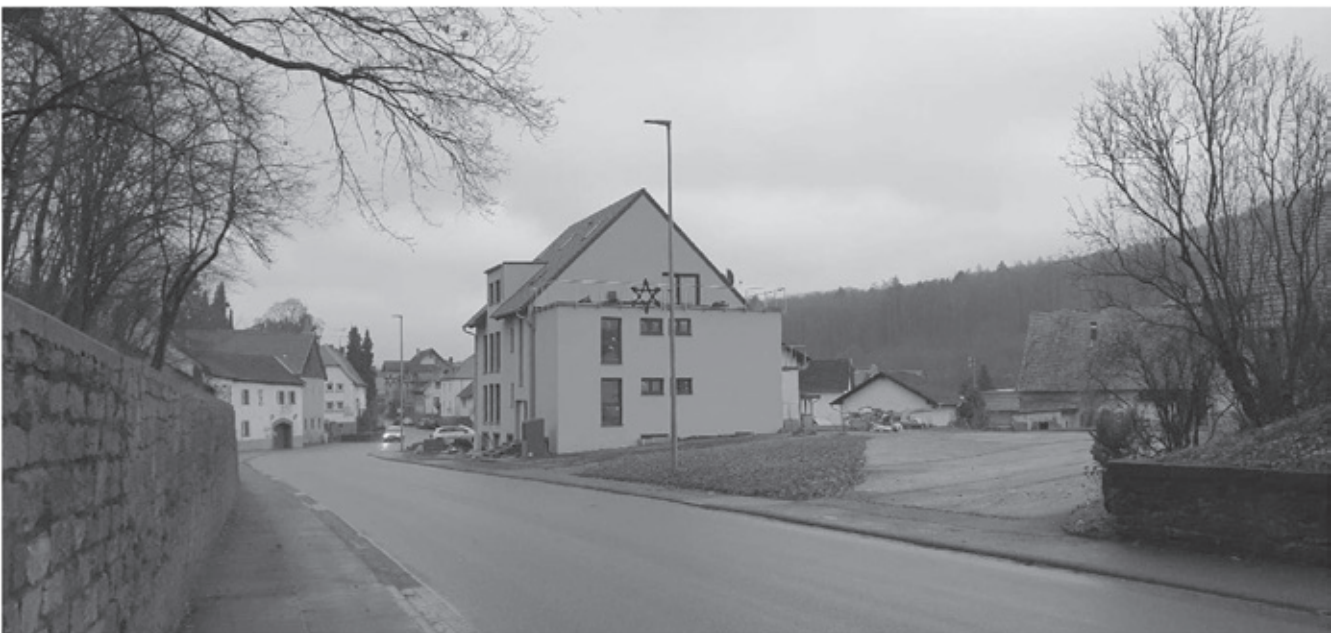
Der Ortseingang heute: Anstelle der Rotsandsteinwand und des Fachwerkgebäudes der ortsuntypische Neubau.