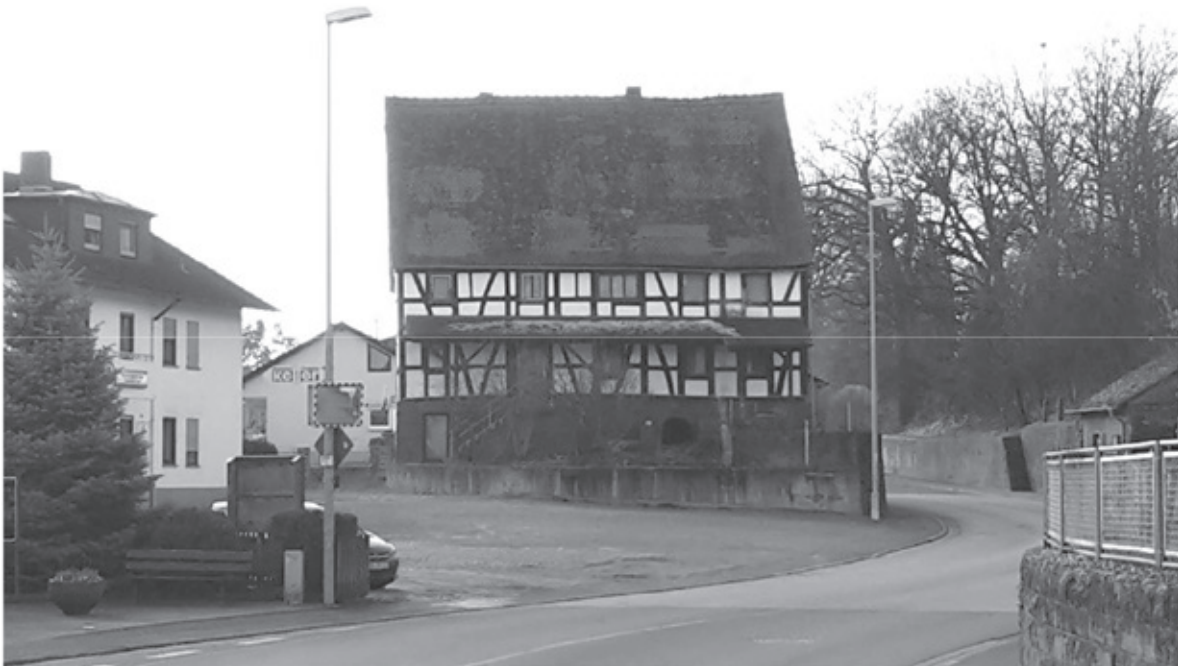
Das abgebrochene Fachwerkhaus in der Aschaffenburg Straße von Osten