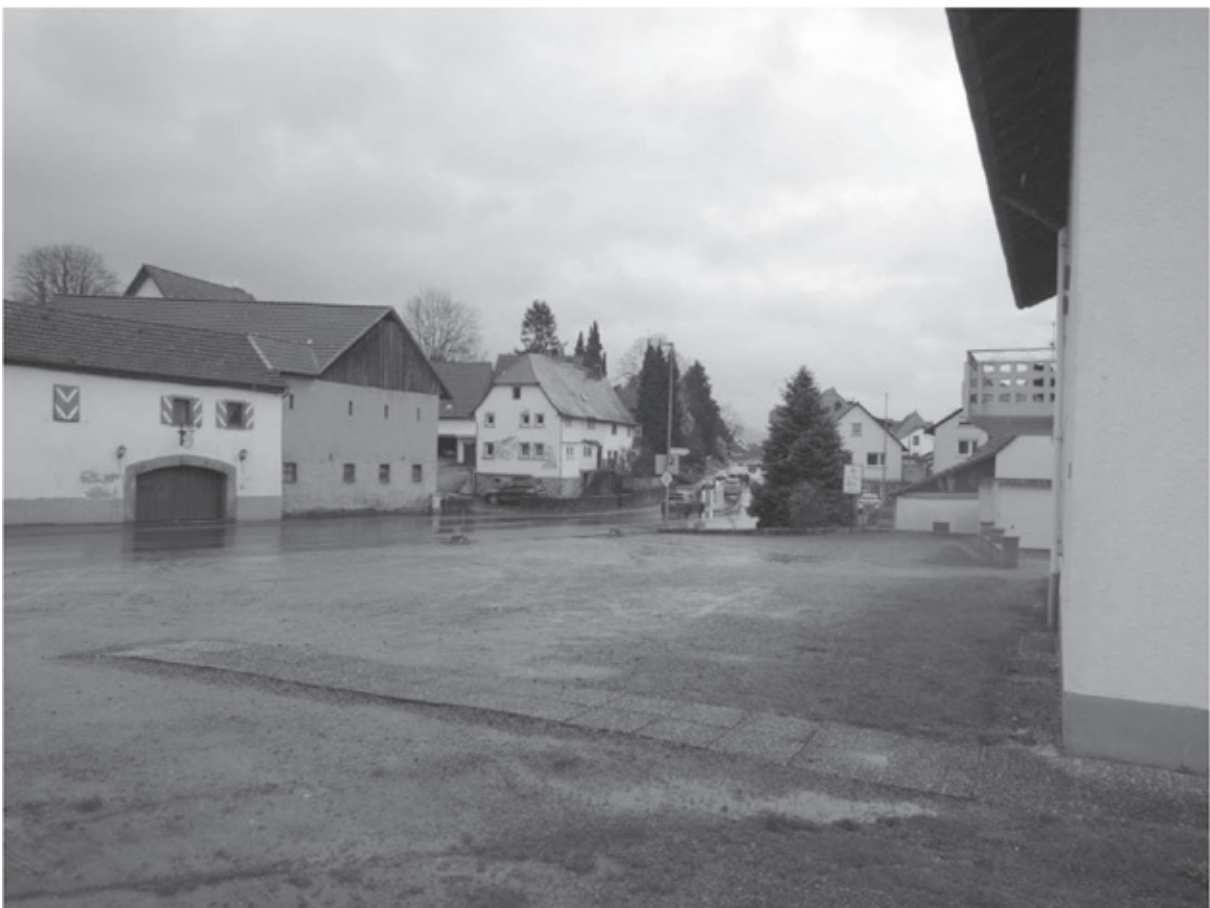
Die Anlage von der gegenüberliegenden Straßeseite aus