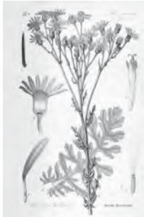
Abbildung 1 Jakobs-Kreuzkraut, Bildertafel aus Thome (1885) www.BioLib.de

Das heimische Jakobs-Kreuzkraut gilt als kritische Giftpflanze des Grünlands, da es durch seine Inhaltsstoffe Weidetiere, wie vor allem Pferde- und Rinder, gefährden kann. Als Nahrung für einige Insekten hat es aber auch seinen festen Platz in unserem heimischen Ökosystem.