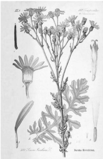
Abbildung 1 Jacobs-Kreuzkraut, Bildertafel aus Thome (1885) www.BioLib.de

Das heimische Jakobskreuzkraut gilt als kritische Giftpflanze des Grünlands, da es durch seine Inhaltsstoffe Weidetiere, wie vor allem Pferde- und Rinder, gefährden kann. Als Nahrung für einige Insekten hat es aber auch seinen festen Platz in unserem heimischen Ökosystem.