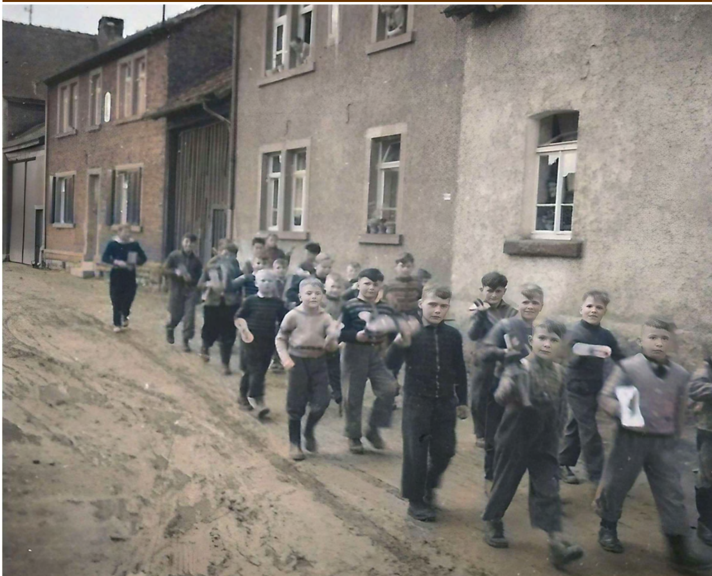
Rätselbild der KW 16: Wir sehen einen Bubenbrauch, der bei uns seit Jahrzehnten nicht mehr ausgeübt wird. Welche Bedeutung hat dieses Ritual, wann und wo wurde dieses Foto aufgenommen? (Die Auflösung erfolgt in der KW 18).