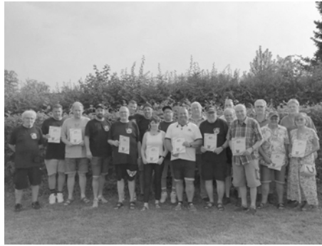
Gruppenfoto aller anwesenden Jubilare

es darauf ankommt. Hierfür und an alle Freunde, Gönner und Gäste herzlichen Dank und Petri Heil.