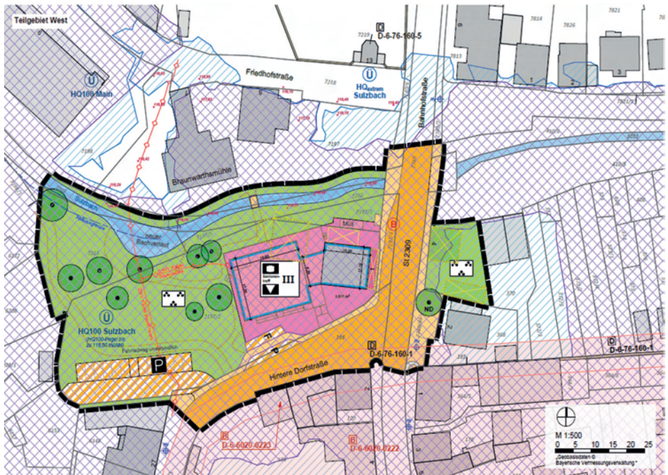
Bebauungsplanentwurf – Teilgebiet West (unmaßstäblich)

Der Marktgemeinderat hat in der Sitzung vom 26.06.2025 den Änderungen zugestimmt und die öffentliche Auslegung gemäß § 3 Abs. 2 BauGB beschlossen.