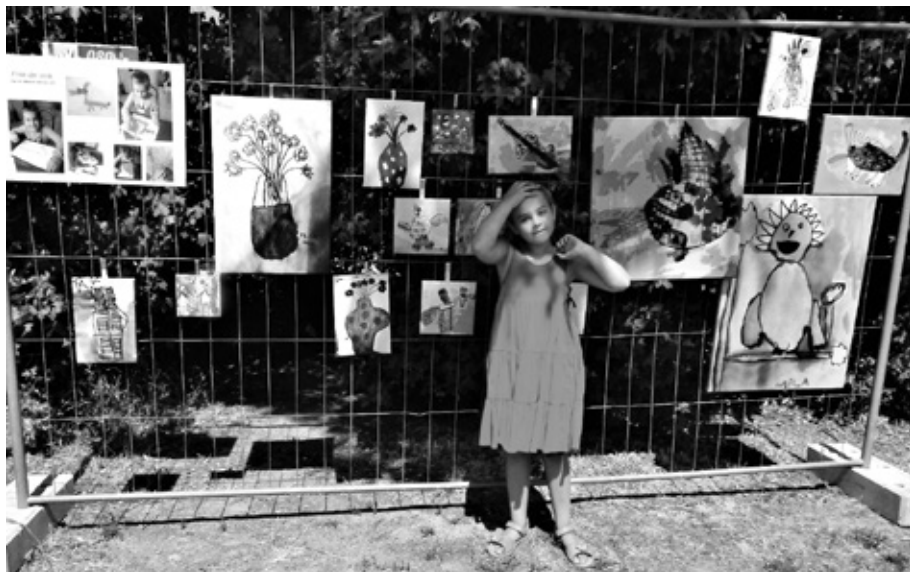
Foto: Werke von Mila Krenz, der jüngsten Teilnehmerin, stellvertretend für alle teilnehmenden Künstlerinnen und Künstler