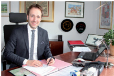
Erster Tag im Amt