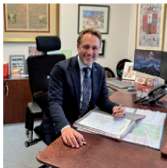
Letzter Tag im Amt